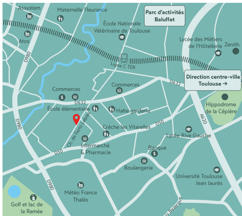
Plan du quartier